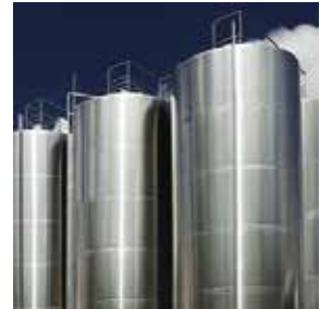
TANQUES E RESERVATÓRIOS EM AÇO INOXIDÁVEL