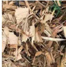
MÁQUINAS PARA TRITURAÇÃO E RECICLAGEM DE RESÍDUOS SÓLIDOS