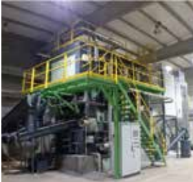
CALDEIRAS PARA GERAÇÃO DE VAPOR E ENERGIA