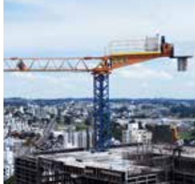
GRUAS PARA A CONSTRUÇÃO CIVIL