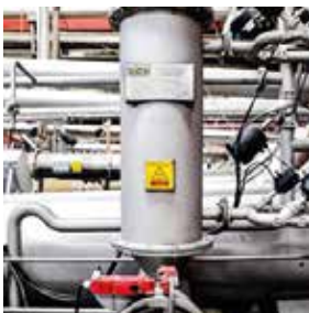
TROCADORES DE CALOR EM AÇO INOXIDÁVEL