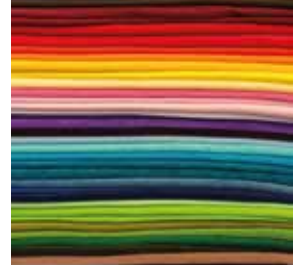
MÁQUINAS PARA TINGIMENTO E BENEFICIAMENTO DE MALHAS E TECIDOS