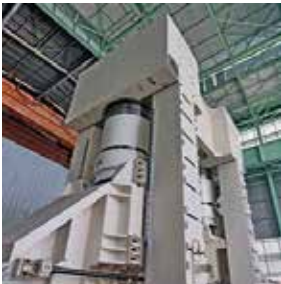
MÁQUINAS E COMPONENTES HIDRÁULICOS DE ALTO DESEMPENHO