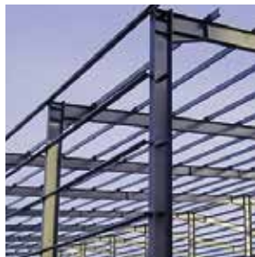
ESTRUTURAS METÁLICAS PREDIAIS