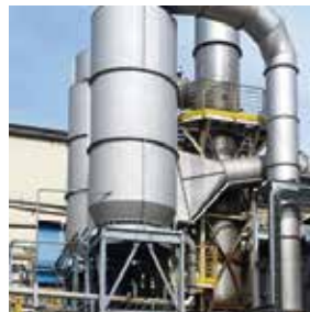
FILTROS DE ALTA PERFORMANCE PARA GASES TÓXICOS