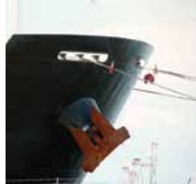
MÁQUINAS PARA ENSAIOS EM CABOS DE AÇO, CORDAS, CINTAS E CORRENTES