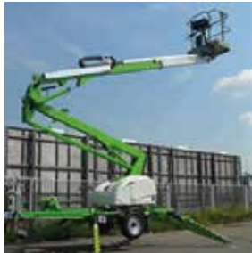
PLATAFORMA ELEVATÓRIA PARA TRABALHO HUMANO EM ALTURA